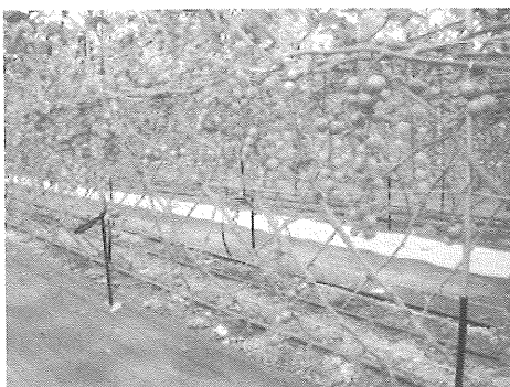
図7 シート埋設栽培床ハウス（試験区）