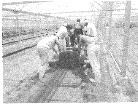
図6 トラクターの馬力が小さい場合の埋設状況