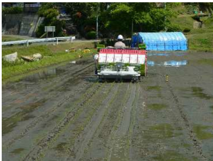
写真5 密苗対応田植機による移植風景。