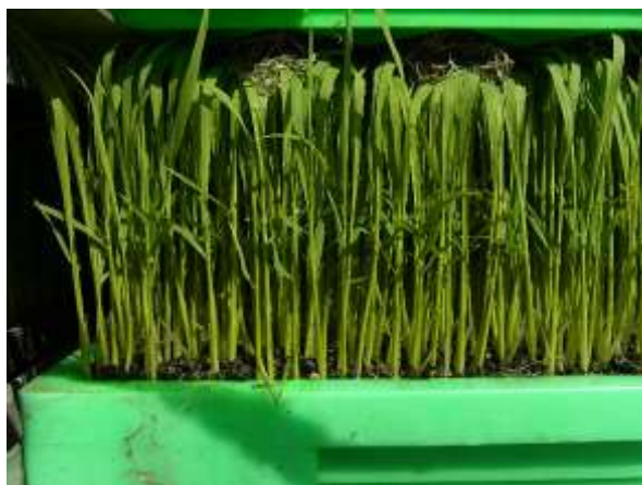
写真4 密苗（乾籾換算 246g）