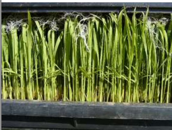
写真3 慣行苗（乾籾換算 137g）