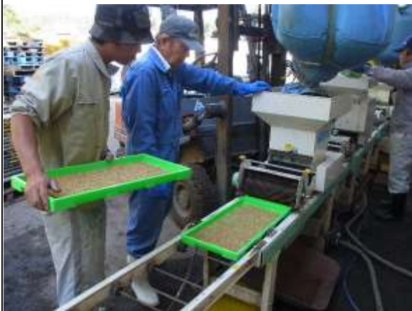
写真1 は種量の調整