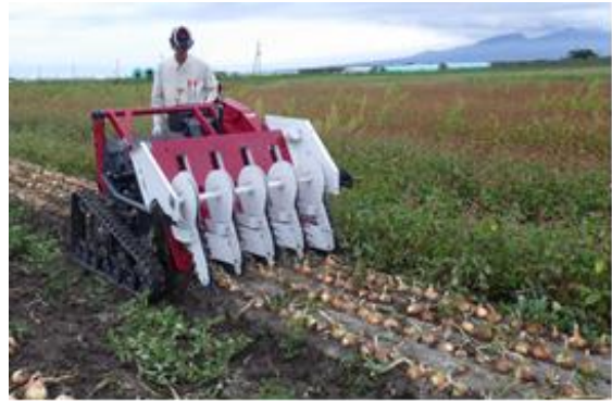
写真2 4条茎葉処理機