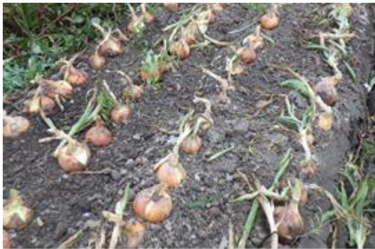
写真3 葉茎処理後の圃場