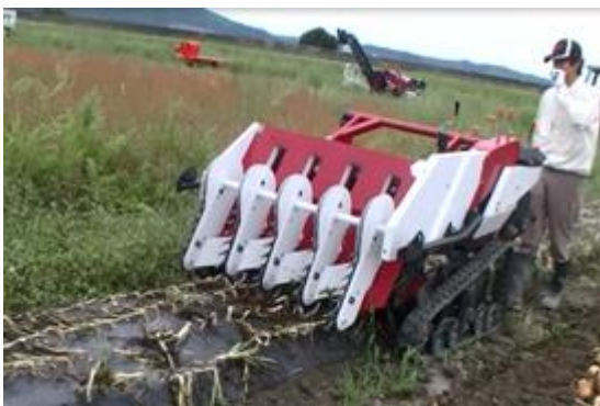
写真9 マルチ対応4条茎葉処理機