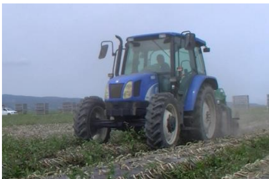
写真7 4条茎葉処理機