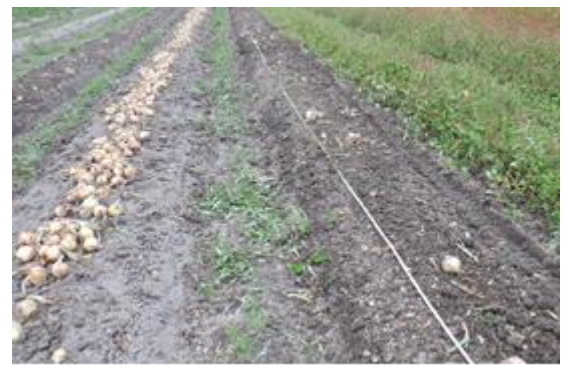
写真6 ピッカー処理前（左）および処理後（右）