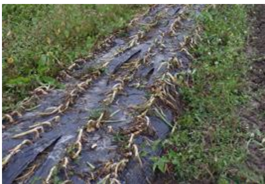
写真10 葉茎処理後の圃場