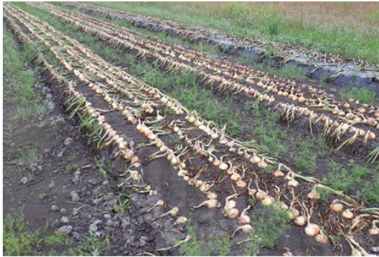
写真1 葉茎処理前圃場