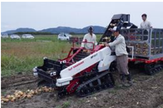
写真5 ピッカー+野菜作業車