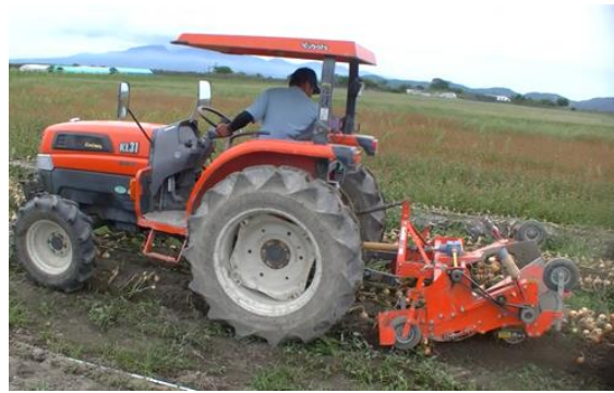
写真4 根切掘取機（参考区①と同様）