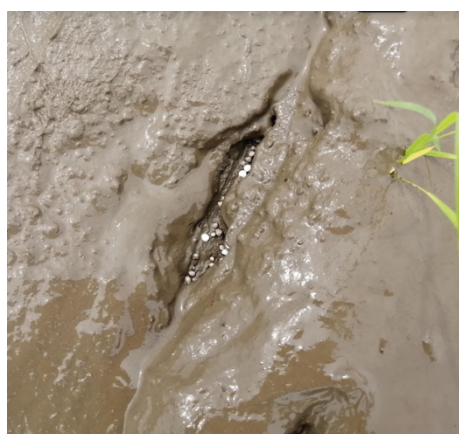
移植時の可変基肥施肥 (ヤンマー社製 可変施肥機能付乗用田植機)