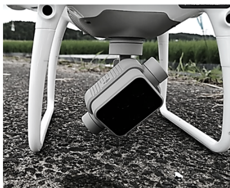
幼穂形成期のリモートセンシング (マルチスペクトルカメラ付ドローン：DJI 社製 P4MULTISPECTRAL)