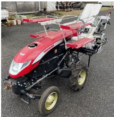
写真1 供試機 全自動野菜移植機 (PW10)